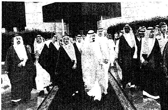
الملك لدى مغادرته الباحة