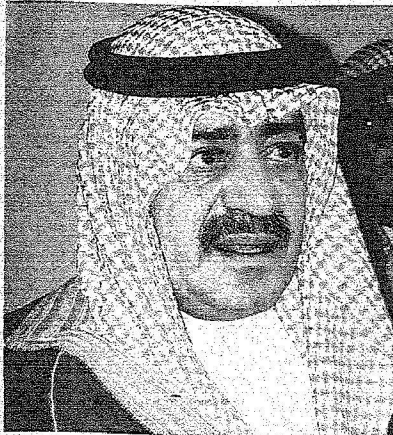
علامات الحزن على وجه الامير مقرن بن عبدالعزيز