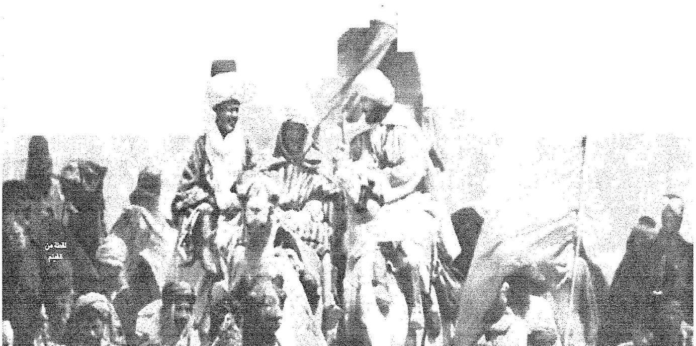
لقطة من العلم