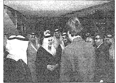
الأمير تركي يتحدث لمنتجي الفيلم