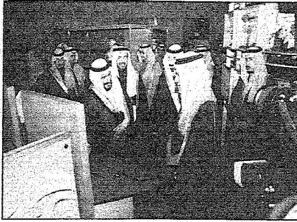
الأمير تركي الفيصل والأمير جلوي أثناء الجولة