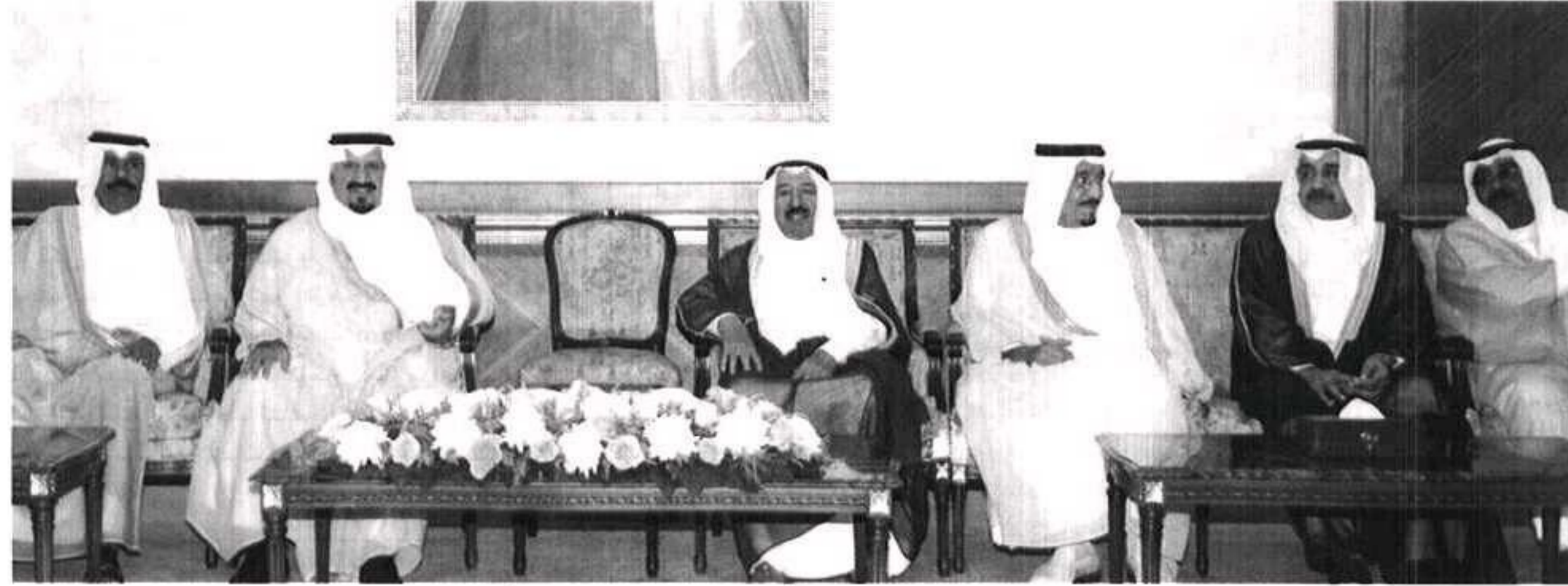
أمير الكويت يتوسط سمو ولي العهد والأمير سلمان ويظهر الشيخ نواف الأحمد

المصدر : الإمامة التاريخ : 27-10-2007 العدد : 1979 المسلسل : 12 الصفحات : 15