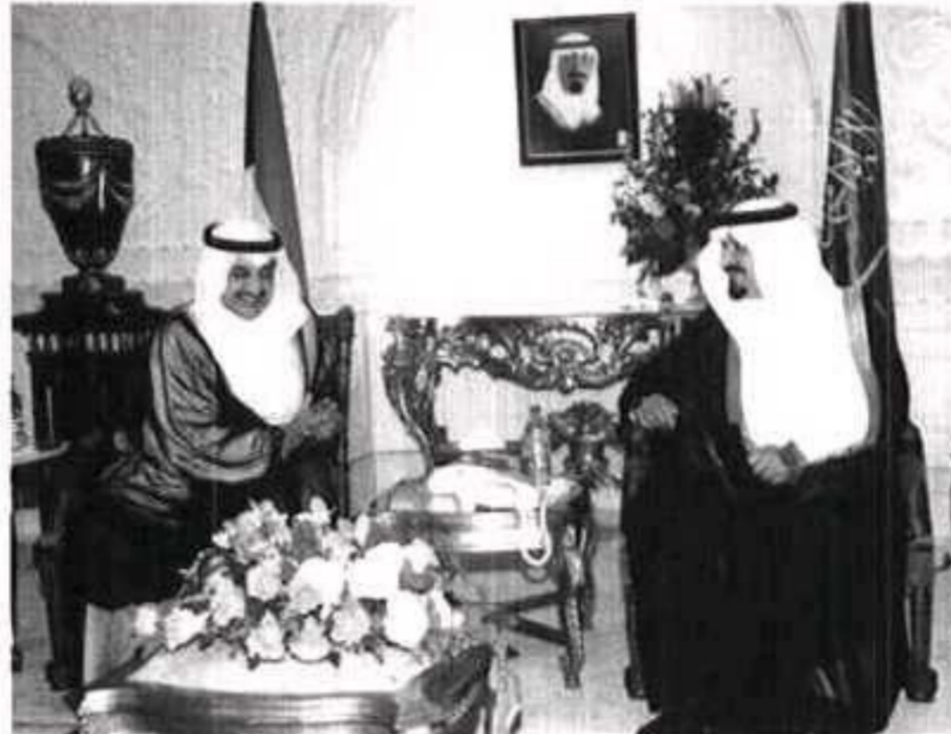
الأمير سلطان مستقبلاً رئيس مجلس الأمة الكويتي

أدام الله على بلدينا نعمة الأمن والاستقرار ووفقنا جميعاً إلى ما فيه خير أمتنا العربية والإسلامية.