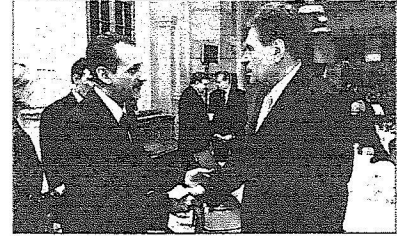
د. شيكشي وزير الاقتصاد الاتلاني وحديث عن سبل دعم العلاقات الاقتصادية

السعودية تعيش بنصف هوية. وبعض الرجال يعاملونها كأسيرة حرب؟ - دور المرأة في المجتمع السعودي هو دور اساسي حيث انها الام والزوجة والأبنة وكل منهن لها دورها الحيوي والهام وما