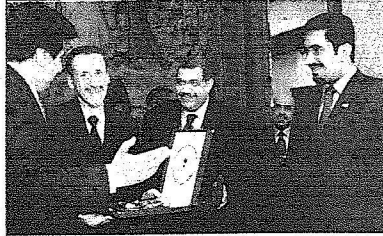
يتبادل التيبايا مع الأميرين سلطان بن فهد ونواف بن فيصل وبينهم بالرحوم البدر

بلورته رشيقة دربي من ان الزوجة السعودية ما زالت تعيش بنصف هوية وذلك بناء على خريتها - دور المرأة في المجتمع السعودي هو دور اساسي حيث انها الام والزوجة والأبنة وكل منهن لها دورها الحيوي والهام وما