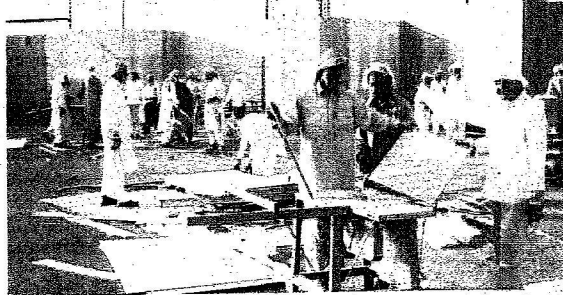
جهود متواصلة لتجهيز الموقع

للأهالي إضافة إلى اعداد مرج خاص من سيحضرون الحفل للفرجة يتسع لحوالي ٧ آلاف شخص وتم التعاقد مع عدد من المطابخ الكبيرة لتوفير حفل العشاء للمدعوين والمترجمين