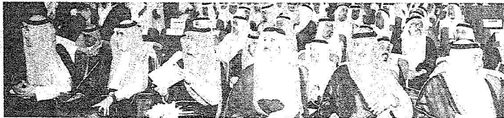
عدد من اصحاب السمو اعلمكي الامراء خلال حضورهم حفل التتشين

واصب سموه سليمان الزليدي قناتلاً: انتم الزود (أكلتم قروشي) مينا انه كان يزور مكتبة الزليدي بالطائف ويشترى منها العراجم العلمية ولازال يحتفظ بها حتى الان. وفي مداخلة من الدكتور محمد احمد الصالح عضو هيئة التدريس بجامعة الامام محمد بن سعود الاسلامية تشرق الى قصة الفتاة التي كانت ترضع القتم وشاهداها الملك عبدالعزيز والحد