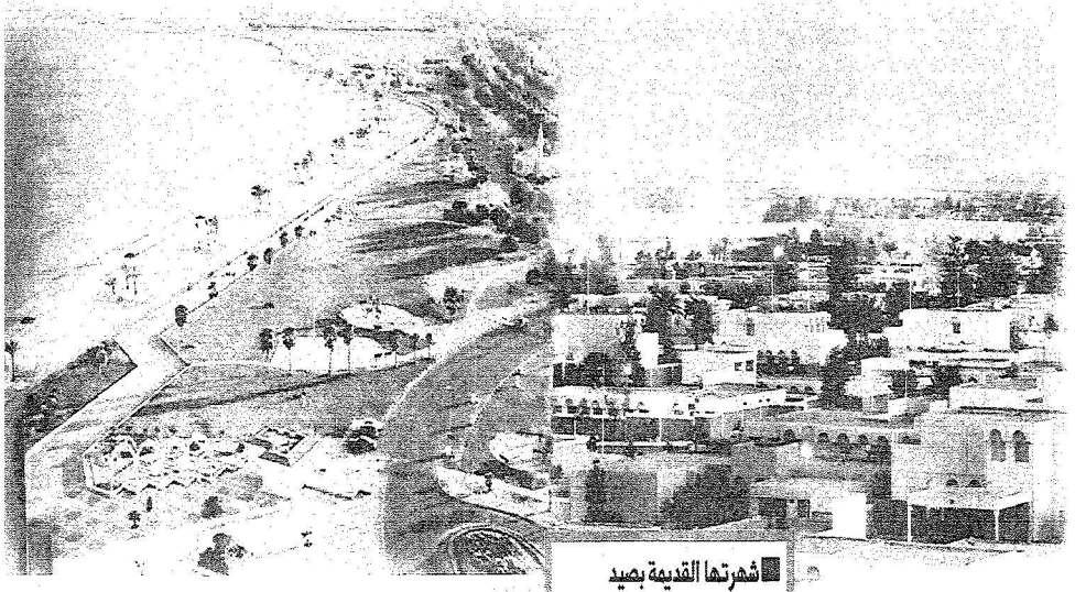
شهرتها القديمة بصيد