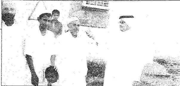
عدد من المواطنين للنازحين يعبرون لـ (الرياض) عن فرحتهم بهذه المكرمة