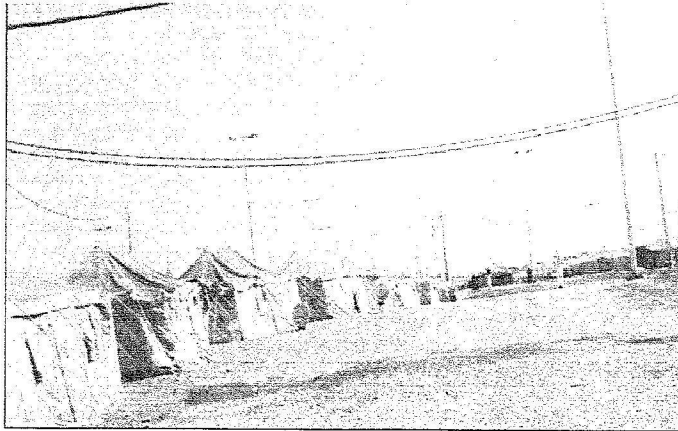
فرحة عارمة عنت مخيم الزبواه بمكرمة للذئب