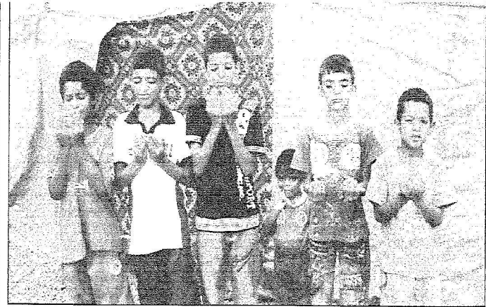
الأطفال الصغار في مخيم الزبواه يحفظون الله مناكفا

الكف البتهلة.. شكركم خادم الحرمين على كرم عطائه