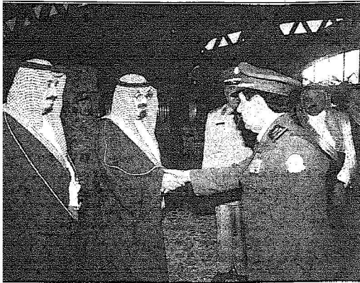
خادم الحرمين يصل إلى الرياض (واس)

الحرمين الشريفين وصاحب السمو الملكي الأمير منصور بن ناصر بن عبدالعزيز وصاحب السمو الأمير الدكتور بندر بن سلمان بن محمد آل سعود. مستشار خادم الحرمين الشريفين وصاحب السمو الملكي الأمير مشعل بن عبدالله بن عبدالعزيز