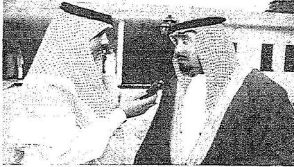
الأمير عبدالله بن جلوي يتحدث للجزيرة