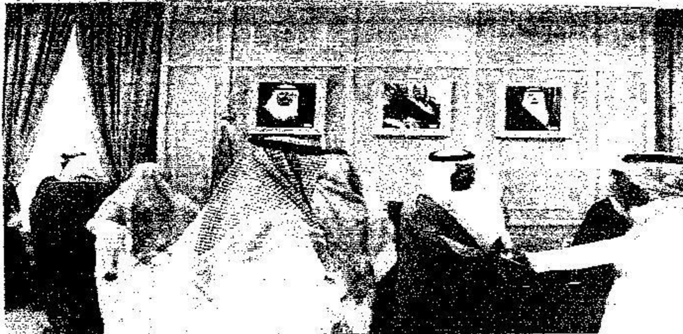
أمير حائل يتلقى الشاري ويحمده السعة من المواطنين.

أن ر.ريم على بلادنا أمنه ورخاهم واستقراره. حضر البهجة الأمير نواف بن مشعل بن سعود بن عبد العزيز الشيخ إبراهيم العبيدان ورئيس محاكم منطقة إسيران وعدد من المسؤولين من مدنيين وعسكريين.