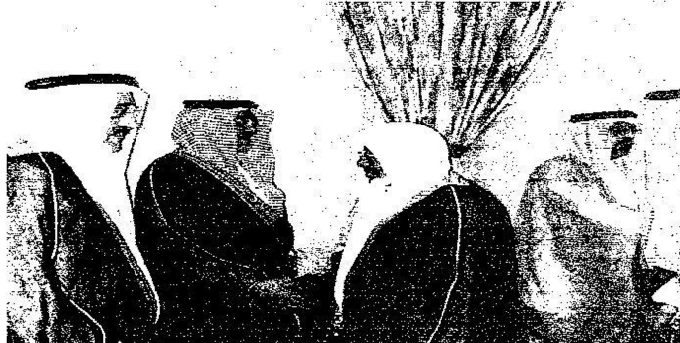
خالد الفيصل ووكيل محافظ الأحساء أثناء استقباله المواطنين.

قيادة حيا بعدد ووفاه به طاقه. كما استقبل الأمير محمد بن ناصر بن عبد العزيز أمير منطقة حجاز ونائبه الأمير فيصل بن خالد بن عبد العزيز نخالي المنطقة في المطار العام في الإمارات الحكومية بقيادة الضامات