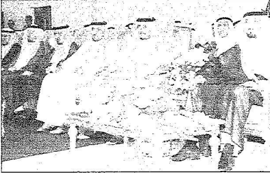
سموه راعياً الحفل