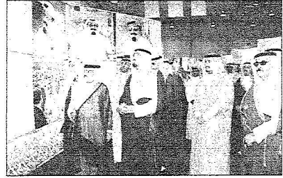
أمير نجران يتجول في معرض شيم وشمال

نجران) واستمع سموه إلى شرح مفصل من القائمين على تلك الأجنحة معرباً عن تقديره للقائمين على تلك المعارض. بعد ذلك أقيم حفل خطابي بهذه المناسبة بدئاً بتلاوة آيات من القرآن الكريم ثم ألقى الدكتور حسين بن عايض آل حمد رئيس هيئة أعضاء شرف نادي الأخدود كلمة نيابة عن أعضاء نادي الأخدود الجهة المستضيفة لفعاليات المعارض المقامة بمناسبة اليوم الوطني. وتشهد الاحتفالات المقامة بمناسبة اليوم الوطني بمقر قصر الإمارة التاريخي العديد من الأنشطة الثقافية والترفيهية والعروض الشعبية في تكري اليوم الوطني، كما تقام فعاليات الحرفيين، ويشهد القصر يوم الجمعة نشاطاً نسائياً يشتمل على مسرحيات ومسابقات للأطفال.