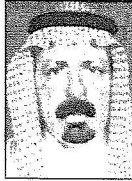
الشيخ حماد العرادي