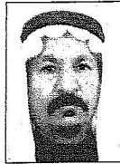
الشيخ رويحي عياد