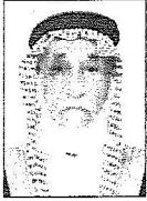
الشيخ عبيد عبيد الفرجي