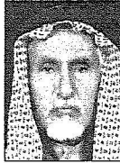
الشيخ محمد حمد الحمودي