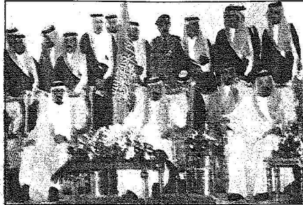
خادم الحرمين وولي العهد خلال استقبال المواطنين