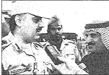
الأمير متعب يتحدث للزميل عوض القحطاني

أهمية مشاركة اللواء في تمرين (عز الوطن) الذي تنفذه قوات الحرس الوطني حيث تم الاستفادة من معطيات التمرين وأهدافه، بعد ذلك استمع سموه إلى إيجاز من أركانأت اللواء عن المهام والواجبات التي تم تنفيذها في التمرين، بعد ذلك قام سموه بزيارة إلى مركز القيادة الأمفي في لواء الأمير تركي بن عبدالعزيز الأول الألي حيث كان في استقبال سموه سمو اللواء الركن تركي بن عبدالله بن محمد آل سعود قائد لواء الأمير تركي بن عبدالعزيز الأول الألي حيث استمع سموه إلى كلمة من سمو قائد اللواء وإيجاز مسوقف من أركانأت اللواء، بعد ذلك قام سموه بزيارة إلى مركز القيادة في لواء الأمير سعد بن عبدالعزيز حيث كان في استقبال سموه قائد لواء