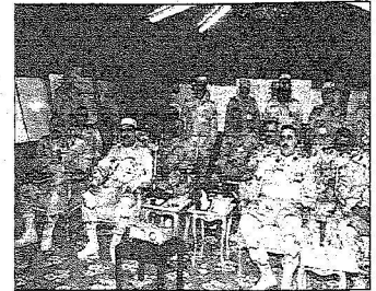
لقطات من الجزيرة

قريباً.. اختيار وشراء الطائرات العمودية الجديدة وتخصيص مواقع ومطارات لها في وحدات الحرس الوطني وحدات الحرس الوطني المكلفة بحفظ أمن المنشآت تعود لمواقعها وتسليمها لوزارة الداخلية