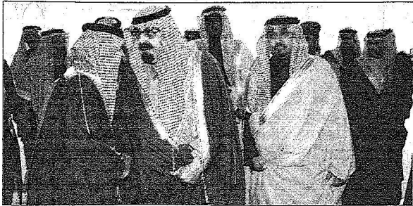
و يستقبل الأمراء والمسؤولين والمواطنين

خادم الحرمين يتسلم رسالة من أمير الكويت ويستقبل ملك السويد وعمدة لندن والأمراء وكبار المسؤولين