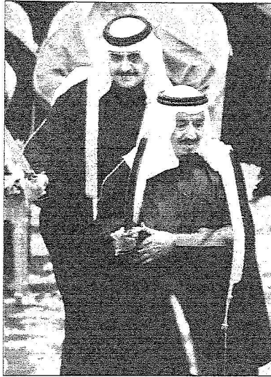
الأمير سلمان والأمير محمد بن فهد يشركان في الحلل

يسرني أن أرحب بصاحب الجلالة الملك حمد بن عيسى آل خليفة ملك مملكة البحرين الشقيقة وصحبه الكرام كما أرحب بدولة رئيس الحكومة الليبنانية الأخ سعد الحريري