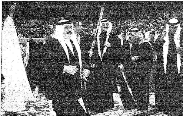
ملك البحرين يؤمى العرشة السعودية