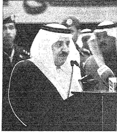
الأمير نايف يلقي كلمته

من المعرفة والعلوم وعلوم التقنية والعلوم الحديثة وهذا مفتاح لكل مواطن سعودي. سيدي.. لا شك أن المملكة العربية السعودية دولة مستهدفة لتمسكها بالإسلام عقيدة ومنهجاً ودستوراً وهذا أمر معلوم ولكن الحمد لله بفضل القيادة الرشيدة ودعم سيدي خادم الحرمين الشريفين سموكم تمكن رجال أمتكم أن يبحروا ويقتلوا كل الاستهدافات والأعمال الخارجة عن الإسلام وهم مدعو الإسلام والإسلام براء من ذلك، وللأسف أن غالبيةهم من شباب غرر بهم من أبناء هذا الوطن والبعض ممن ساعدوهم في الفكر وجمع الأموال ، ولقد تمكنت قواتكم الأمنية معتمدة على الله عز وجل مؤمنة به ثم خدمة لهذا