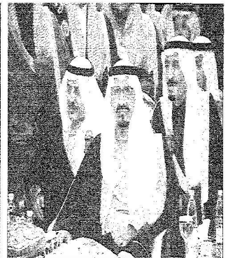
الأمير سلطان خلال حضوره الحقل الذي أقيم سموه الملك الثاني