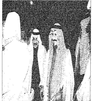
الأمين سلطان لدى وصوله مقر العمل