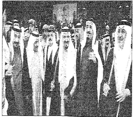
ولي العهد مشاكياً أصحاب السمو في الحقل