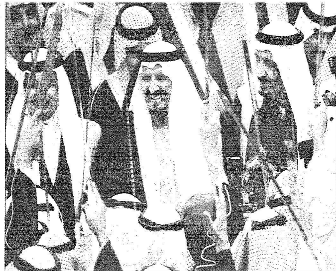
ولي العهد، مشاركاً في العرصة السعودية

بحضور ملك البحرين والجزيري وحشد من الأمراء والمسؤولين وجموع غفيرة من المواطنين