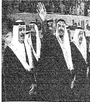
الأمين سلطان يحيى الحضور، رأس جواره ملك البحرين وياسر آل ثاني نائب وليد سمو الأمير سلطان