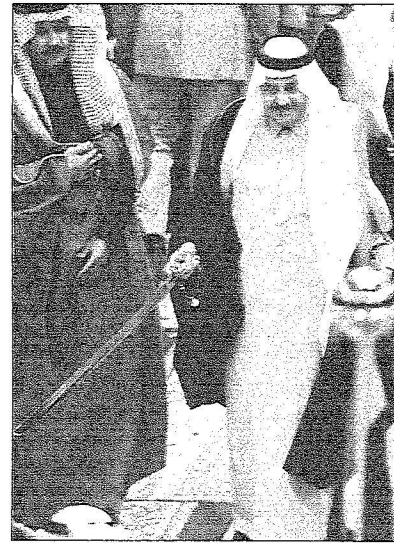
سمو الناكب الثاني يؤدي العرصة