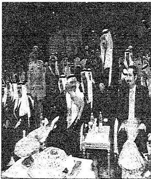
سموه وأقاربهم تعبيراً عن مشاركة الضيوف لرحيم