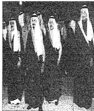
ولي العهد والملك حمد والأمير نايف والأمير سلطان أثناء التماثيل للكتين العمريين والسعودي