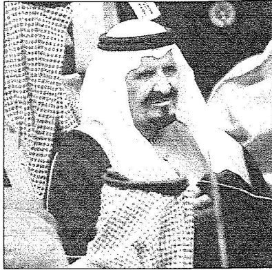
الأمير سلطان يؤدي العرصة

شرف صاحب السمو الملكي الأمير سلطان بن عبدالعزيز آل سعود ولي العهد نائب رئيس مجلس الوزراء وزير الدفاع والطيران والمفتش العام بحضور جلالة الملك حمد بن عيسى آل خليفة ملك مملكة البحرين مساء أمس ودولة رئيس مجلس الوزراء اللبناني سعد الحريري الحفل الذي أقامه صاحب السمو الملكي الأمير نايف بن عبدالعزيز النائب الثاني لرئيس مجلس الوزراء وزير الداخلية احتفاءً بعودة سمو ولي العهد أرض الوطن، وذلك بمقر الصالات الرياضية بمجمع الأمير فيصل بن فهد الأولمبي بالرياض.