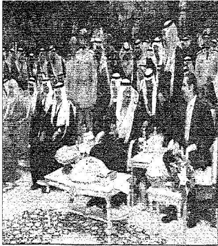
الأمين سلطان خلال السفر إلى جواره ملك البحرين ودولة قطر لأمير البحرين