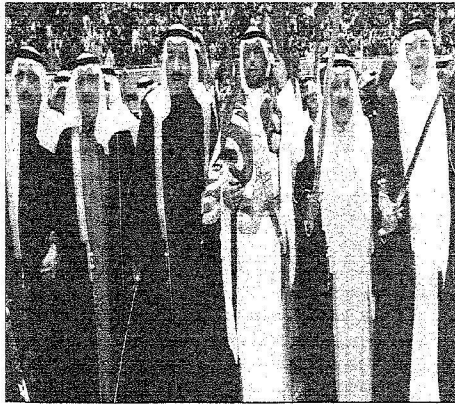
أصحاب السمو الملكي الأمير وليدون العرعة السعودية