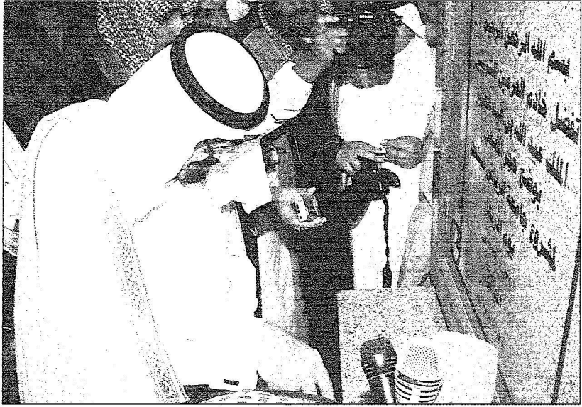
خادم الحرمين يضع حجر الأساس لجامعة الأميرة نورة

الأميرة الدكتورة الجوهرة بنت فهد: نجده البيعة لمليكننا ووالدنا وقائدنا الملك عبدالله