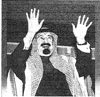
نجلد الوفاء .. ملك الرخاء

تدريبية ضمن برنامج تطوير الأداء لوظفي الجامعة لتزويدهم بالمعارف والمهارات التي تساعدهم على أداء مهامهم الوظيفية بفاعلية وكفاءة. هذا وقد بلغ إجمالي عدد المتدربين من ١٤٢٨/٣/١٦هـ وحتى تاريخه ٣٧١٥ متدربة منهم ٢٩٩٥ من أعضاء هيئة التدريس ومن في حكمهم ٧٢٠ عضواً من أعضاء الهيئة الإدارية والفنية وقد تم التدريب داخل المملكة بنسبة ٧٧,٦٪ من إجمالي المتدربين، ٢٢,٤٪ خارج المملكة من إجمالي من تم تدريبهم.