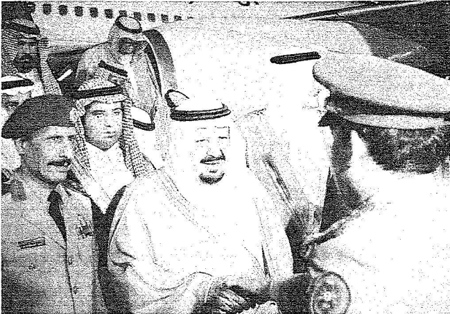
تأهيلية - واس - عبد الرحمن الشجيري :

رعى صاحب السمو الملكي الأمير عبدالرحمن بن عبدالعزيز نائب وزير الدفاع والطيران والمفتش العام أمس الأول حفل تخريج الدورة الثامنة عشرة من طلبة المعهد الملكي الفني للقوات البرية بمنطقة القصيم وذلك بمقر المعهد، وكان في استقبال سموه لدى وصوله المعهد صاحب السمو الملكي الأمير عبدالعزيز بن ماجد بن عبدالعزيز نائب أمير منطقة القصيم وقائد القوات البرية الفريق الركن حسن بن عبدالله القبيل وقائد المعهد الملكي الفني للقوات البرية بمنطقة القصيم اللواء الطيار الركن محمد بن سعيد الزهراني.