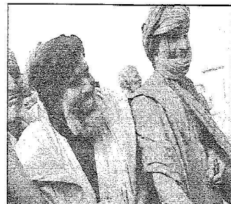
إمام مسجد بلدية السلام وابنسامة فرح برؤية الوفد السعودي