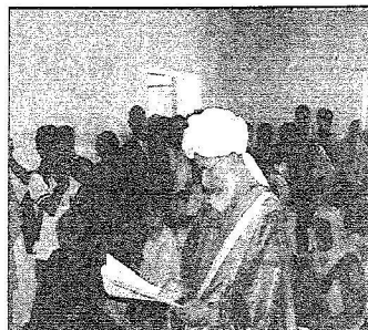
عدة بلدية للسلام: مساعداتكم وصلتنا وشكرا مملكة الإنسانية