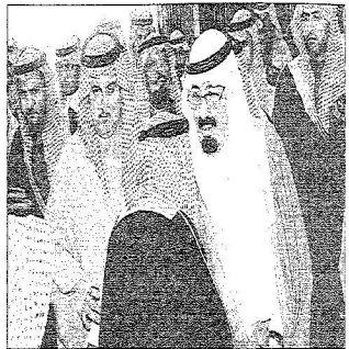
- ويستقبل الوزراء وكبار المسؤولين والوطنيين