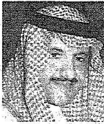
الأمير سلطان بن سلمان