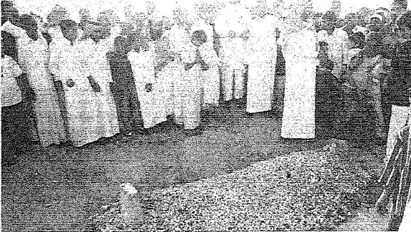
جموع من المواطنين يدعون للفقيد أمام قبره