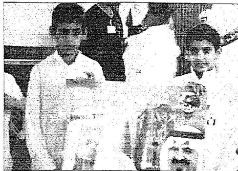
إبداعات للطلاب تجسد الاحتفال باليوم الوطني