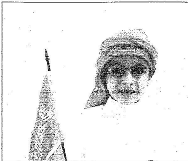
طفل يحتفل باليوم الوطني (اليوم)