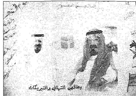
طلاب يشاركون الوطن فرحته