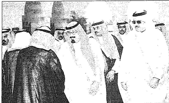
خادم الحرمين الشريفين لدى مفارقتها جدة أمس

وقد وصل بمعية خادم الحرمين الشريفين رعاه الله صاحب السمو الملكي الامير متعب بن عبدالعزيز وزير الشؤون البلدية والقروية وصاحب السمو الملكي الامير سعود الفيصل وزير الخارجية وصاحب السمو الملكي الامير مقرن بن عبدالعزيز رئيس الاستخبارات العامة وصاحب السمو الملكي الفريق اول ركن متعب بن عبدالله بن عبدالعزيز نائب رئيس الحرس الوطني المساعد للشؤون العسكرية وصاحب السمو الامير تركي بن عبدالله بن محمد ال سعود مستشار خادم الحرمين الشريفين وصاحب السمو الملكي الامير محمد بن نايف بن عبدالعزيز مساعد وزير الداخلية للشؤون الامنية وصاحب السمو الملكي