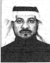
محمد بن عبد العزيز

بجولات تفقدية لمساعدة إخوانه وأبنائه في مختلف المناطق السعودية، هذا إن دل إنما يدل على مدى التواصل لدى هذا القائد العظيم فكثيراً ما فُرج بزياراته كرب المحتاجين ورسم الابتسامه على محيا الأيتام والفقراء وسد حاجاتهم ما أجل هذه الزيارة وما أوجنا إليها لنشاهد قائداً عن قرب وتتحدث إليه لكي نستطيع أن نعبّر له عما في صدورنا من محبة عظيمة له، هذا الإنسان والذي طور مختلف الخدمات التي يحتاجها الإنسان السعودي والمقيم على حد سواء علسى أرض هذه البلاد ولن تكمل جهود سمو الأمير عبدالله بن عبدالعزيز بن مساعد آل سعود أمير منطقة الحدود الشمالية مما كان لها الأثر البالغ والواضح في تطوير المنطقة وازدهارها في ظل الرعاية الكريمة من حكومة خادم الحرمين الشريفين. وكل كلية المعلمين في عرعر أحمد موسى بقول تشكل زيارة خادم الحرمين الشريفين أهمية كبيرة لهذه المنطقة والتي تدخلها ضمن أهم المناطق الاقتصادية من خلال المشاريع التي سوف تحظى بها المنطقة خلال زيارته يحفظه الله فعم أيضاً حل تحل البركة ويعم الخير المكان ولا ننسى بهذا الجانب الدور الإيجابي الذي قام به أمير المنطقة.