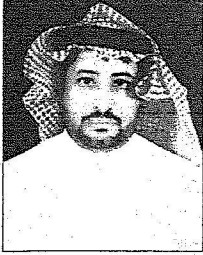
سليمان بن عبدالعزيز

وقال مدير مدرسة عبدالله بن عباس الابتدائية فلاح جميعان الرويلي إن زيارة خادم الحرمين الشريفين تشكل أهم مرحلة لهذه المنطقة التي لطالما انتظرت طويلاً فأهلاً به وبصحبه الكرام وعلى الرحب والسعة فقلوبنا مفتوحة لهذا الرجل الكريم الذي يحرص دائماً على تفقد أحوال شعبه واحتياجاته.