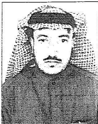
خالد بن عبدالعزيز

وقال مدير متوسطة عبدالله بن مساعد في عرع محمد منيان المضياي العنزي إن زيارة خادم الحرمين الشريفين تشكل بعداً هاماً في حياة أهل منطقة الحدود الشمالية فهذه الإنسان يجمع الخصال الحميدة ويسعى دائماً للتواصل مع شعبه من حب وتلاحم القيادة مع الشعب، دائماً ما يتفقد أحوال شعبه وحاجاته في مختلف مناطق الملكة وهذا ما هو واضح للعيان من خلال جولاته المستمرة والتي بلاشك غيرت كثيراً من