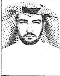
محمد بن عبد العزيز

وقال الحميدي سيار العنزي في هذا اليوم تشرفت مدينة عرعر بقدم سيدي ووالدي ومليكي خادم الحرمين الشريفين الملك عبدالله بن عبدالعزيز آل سعود كما تشرفت بعهد الأمين صاحب السمو الملكي الأمير سلطان بن عبدالعزيز آل سعود وصحبيهما الكرام وكانوا في ضيافة أميرنا الغالي صاحب اليد البيضاء على المنطقة سمو الأمير عبدالله بن عبدالعزيز بن مساعد آل