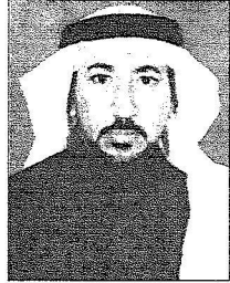
مزمي بن عبدالعزيز

الزيارة التي يقوم بها خادم الحرمين الشريفين تجد أسمى معاني الحب والإنسانية بين القائد والشعب قائد عظيم أحب هذا الشعب وعمل على راحته في عرس مختلف المشاريع العمرانية والاستثمارية والاقتصادية والتعليمية والصحية وما هو اليوم يزور منطقتنا ليؤسس بها مشاريع الخير والنماء والعبطاء والسخاء فأهلاً وسهلاً به وبسمو وفي عهده الأمين الأمير سلطان بن عبدالعزيز وصحبهم الكرام في هذه المنطقة التي لن تنسى أميرنا المحبوب عبدالله بن عبدالعزيز بن مساعد آل سعود الذي عمل على مدى خمسين عاماً لتطوير المنطقة ولاقتسام مرافقها الحيوية حتى وصلت إلى ما وصلت إليه فجاء الله خير الجزاء في ظل الرعاية الدائمة من حكومتنا الرشيدة بقيادة خادم الحرمين الشريفين وسمو وفي عهده الأمين وشجرتهم المباركة.