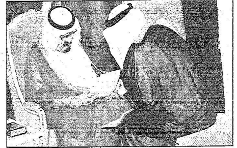
الملك خلال استقباله لعدد من المواطنين يوم أمس