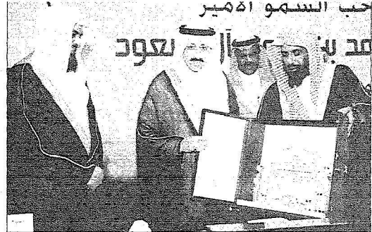
درع تكريمي لمحافظة الاحساء