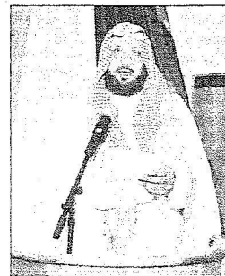
الشيخ سامي العادي