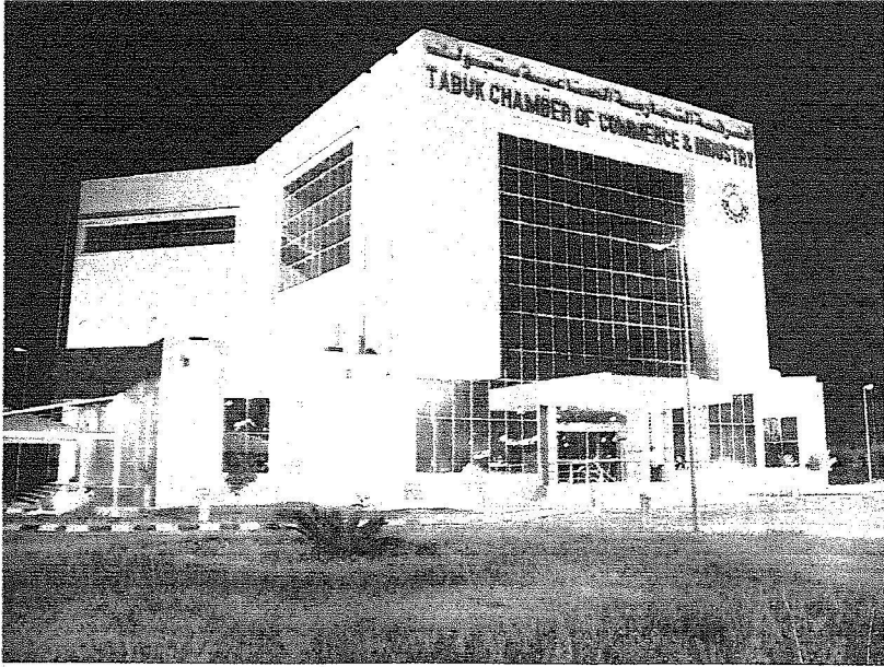
مبنى الغرفة التجارية في تبوك.

هذه المشاريع التنموية هو أصدق دليل على تجسيد معاني الحب والولاء، إذ تربطه علاقة متينة مع محبيه من شعبه الوفاي.