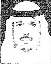
الدكتور سلطان الشري