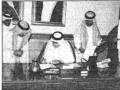
سموه بيارك اتفاقية العنونة البريدية