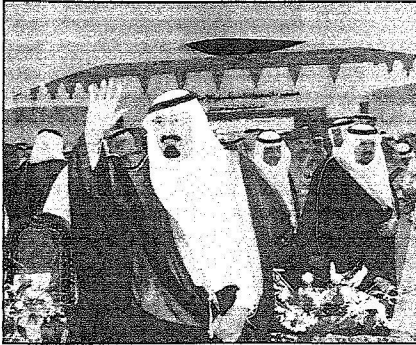
الملك عبدالعزيز رحمه المواطنين في حائل