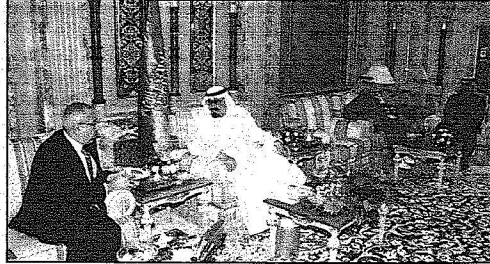
خادم الحرمين خلال اجتماعه مع فياض