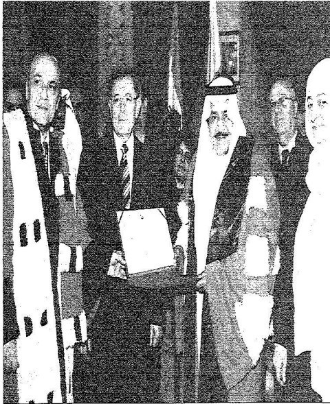
سعد العتيبي خلال تسلمه الدكتوراه الفخرية من الجامعة اللبنانية في العلوم السياسية