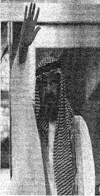
خادم الحرمين الشريفين الملك عبد الله بن عبد العزيز