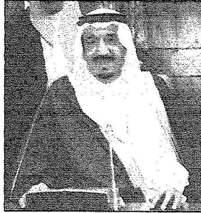
الأمير سلمان بن عبدالعزيز يفتتح موقع مؤخر الأسفل على الانترنت