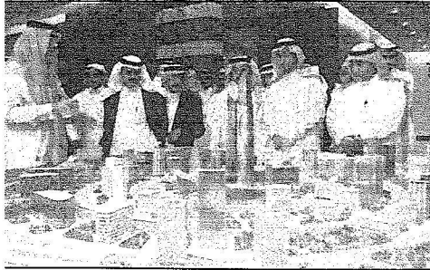
وفد الرياض، في زيارته لهيئة الإستثمار