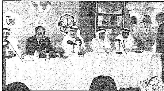
أمير عام للجامعة العربية عمرو موسى خلال أحد اللقاءات بمبنى جدة الاقتصادي