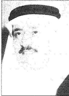
محمد بن سعود

خدت عنه من أصحاب السمو الملكي الأمير محمد بن سعود بن عبدالعزيز من مديين وعسكريين عن الخطاب التوثيق الذي قمعه حاتم الحويين الشويخين الملك عبدالعزيز في مجلس الشورى وتداول عهد السياسة الباعلة بأفكاره لبلادنا وحدثنا في لقاءنا مع "البلاد" حول الرؤية الواضحة التي طرحها قائد مسيرة الوطن في الحقبة المظلمة من تاريخ بلادنا الغريبة أمير صاحب السمو الملكي الأمير محمد بن سعود بن عبدالعزيز أمير منطقة الباحة أن الكوفة الصامية قام الحويين الشويخين الملك عبدالعزيز بن عبدالعزيز بحفظه الله عن افتتاح أعمال مجلس الشورى في يومه الأربعاء لسنه الثالثة يأتي ويتفقه عمل ترسيم الأعداد في هذه المطبوعات والتطبيقات وقال سعيد أن الكوفة ما جعلته من معاني ومعارف أما بركة الشيوخ الحكيم لتأسيسه الوطن الرامية نحو رخاء الوطن وقامه المواطن وجم الشيوخ الذي إعتاد عليه أبناء الوطن من قدامتكم الرصيدة عند عهد الفسوس والمجد تلك عبدالعزير طيب الله ثراه وقال أسر منطقة الباحة أن المنصعب يتكلمه الملكة الكريمة بريك يدعو الحب والاحترام الذي يتبناه الملك نحو احترام الشخصية الشاملة لكل بيوم الوطن وتطويع الأداء وتفعل دور القضاء لضمان العدالة وعملية الحقبة الأساس وتضميد جرحه الله نحو أداء الامانة على الوجه الأمثل معصرا أن كل انسان حليم في موقعه بحسب ما أوتي من مسيطرة وأمانه وفي هذا تأكيد من الملك العدي بأهمية أداء الامانات على الوجه الأمثل وقد صب بتفهمه التام بعد أن اغتمه بذلك العدي عن وجه هذا دليلاً رفيع على حد هذا القائد العظيم وأخلاصه لوطنه وبلاده حد رفيعه بحفظه الله بالاحترام والانتقال لما فيه رغبة البلاد وشهوهه واكد سمو أمير المنطقة الأمير محمد بن سعود بن عبدالعزيز بأن ما تضمنه الملكة حالياً من اقتراح اقتصادي