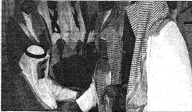
و يستقبل الامراء وجمعا من المواطنين