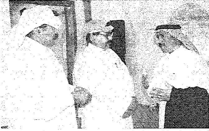
حوارات جانبية اقرت محاور الندوة