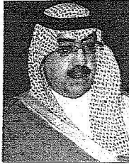
الأمير فيصل بن عبدالله