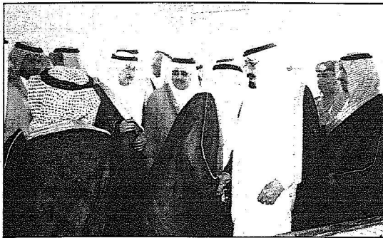
خادم الحرمين مستقبلاً للمشايخ وكبار المسؤولين وللمواطنين