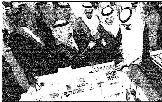
خادم الحرمين يطلع على مشروع مؤسسة الملك عبدالله لوالديه لإسكان التثوي

خادم الحرمين يستقبل في عرعر المشايخ وكبار المسؤولين المدنيين والعسكريين وجمعاً من المواطنين