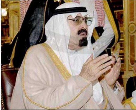
○ خادم الحرمين الشريفين ودعاء من القلب في رحاب المسجد النبوي ○