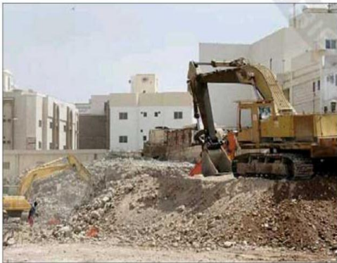
○ جانب من أعمال الإزالة في الجهة الغربية أمس. ○