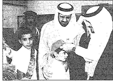
ويضع قبة وطنية على رأس الطفل