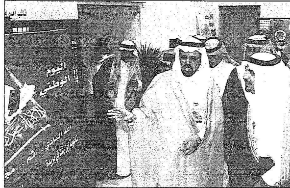
سموه يطلع على المعرض الوطني