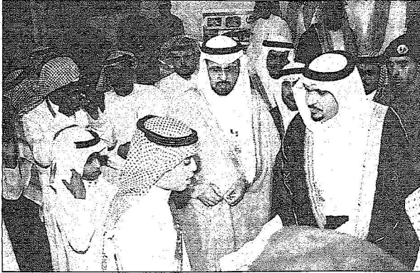
ويستمع لأحد الطلاب