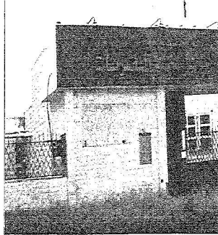
مقر جالي من المعلقة