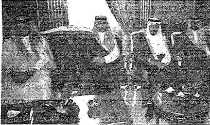
اعضاء اللجنة الاشرافية