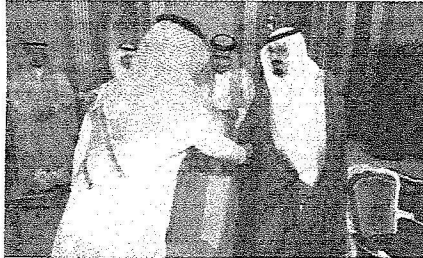
خادم الحرمين يصافح اعضاء اللجنة