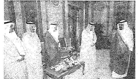
خادم الحرمين اثناء تسلمه شهادة جائزة الشرق الاوسط للتميز