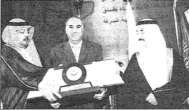
مراسم تسليم منظمة الصحة العالمية شهادة خلو الملكة من شلل الأطفال