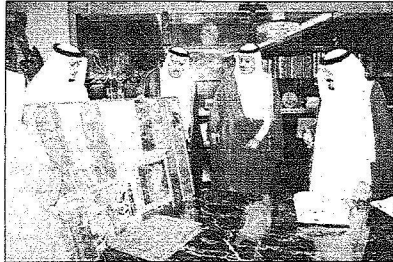
الأمير سلطان خلال استقباله الأمير فيصل بن محمد بن سعود

سعوده علي الخريوش ، وقد تشرف سمو الأمير فيصل بن محمد بتقديم هدية تذكارية لسمو ولي العهد هي اللوحة التذكارية التي حازت على جائزة باحة الفنون التذكارية للفنان التشكيلي السعودي سامي البار . حضر الاستقبال صاحب السمو الأمير الدكتور مشعل بن عبد الله بن مساعد مستشار سمو ولي العهد ومهالي رئيس ديوان سمو ولي العهد علي بن إبراهيم الحديدي والسكرتير الخاص لسمو ولي العهد محمد بن سالم الري .