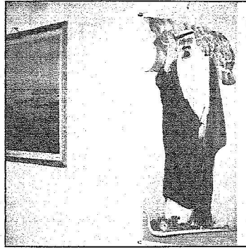
لوحة كبيرة في محل المرکز تصل صورة ملك الإنسانية