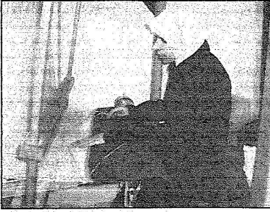
يحدى المكوفات تعمل على التسيج