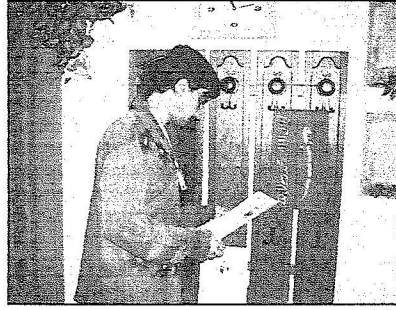
الرياض،تطلع على أعمال ومقتنيات المركز

الخاص بتأهيل الكففيات، وهذه بفضل الله ثم بدعم حكومة خادم الحرمين الشريفين وما تقدمه من دعم مادي ومتابعة لكفاية الاحتياجات اللازمة للمركز، حيث حظى المركز بزيارات متعددة لعل من أبرزها زيارة خادم الحرمين الشريفين الملك فهد بن عبدالعزيز - رحمه الله - إبان توليه وزارة المعارف سابقاً، بالإضافة لزيارة صاحب السمو الملكي الأمير فيصل بن فهد - رحمه الله - وسمو الأمير نواف بن فيصل بن فهد، وكذلك زيارات لمعالي وزراء التربية والتعليم على التوالي.