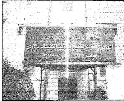
مبنى المركز في عمان