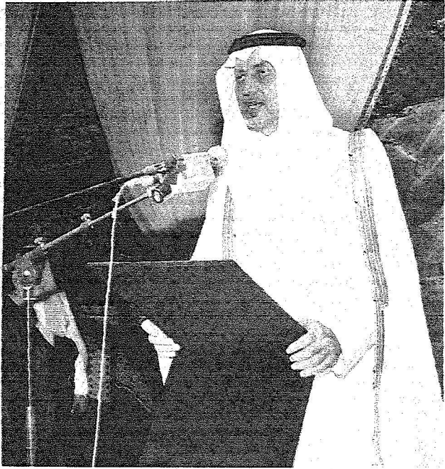
الأمير خالد الفيصل يلقي كلمته أمام الملك وولي العهد.